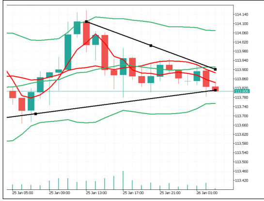
図 3.3: EMA,BBAND,TRENDLINE