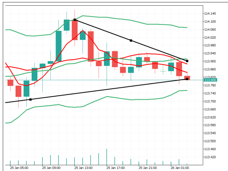
図 4.5: 波及メカニズム