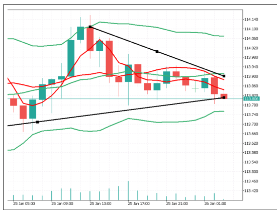
図 2.3: 時系列データの例: 為替時系列