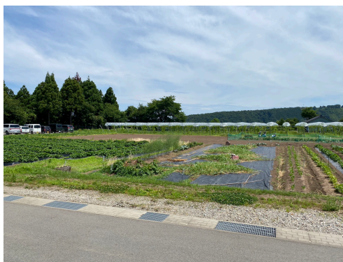
図 3.1: ぶどうの森

今回の研究において対象となるのは、図 3.1 に示すぶどうの森である。この施設では、主にぶどうの栽培や、さつまいもの収穫といった農作業を軸とした業務内容を特徴としている。