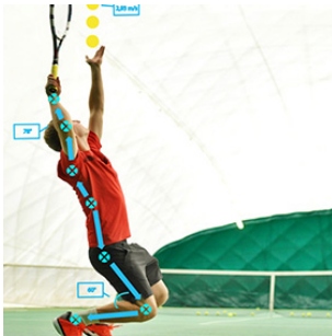
図1：マーカーレスモーションキャプチャの事例

従来のモーションキャプチャにおいて実用に限りがあった原因であるお値段、計測空間、装置の装着の課題をクリアさらに骨格認識技術を加えた新たな手法（マーカーレスモーションキャプチャの3次元動作解析）を用い、医療者が患者から離れた場所からでも動きをとらえ、支持することができる自宅リハビリの補助を提案する。[1]