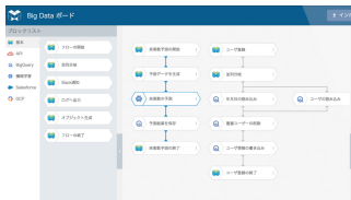
Figure: MAGELLAN BLOCKS の画面

2017 年に発売された機械学習サービス。フローチャートのようにブロックを画面上に並べて解析対象のデータを与えることで、機械学習を利用することができるサービスである。