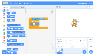
Figure 1. Scratch の画面

子供向けの教育用として開発されたビジュアルプログラミング言語。猫を動かすプログラムを作るのだが、自分でプログラミング言語を書くのではなく、ブロックを並べて視覚的にプログラミングをすることができる。